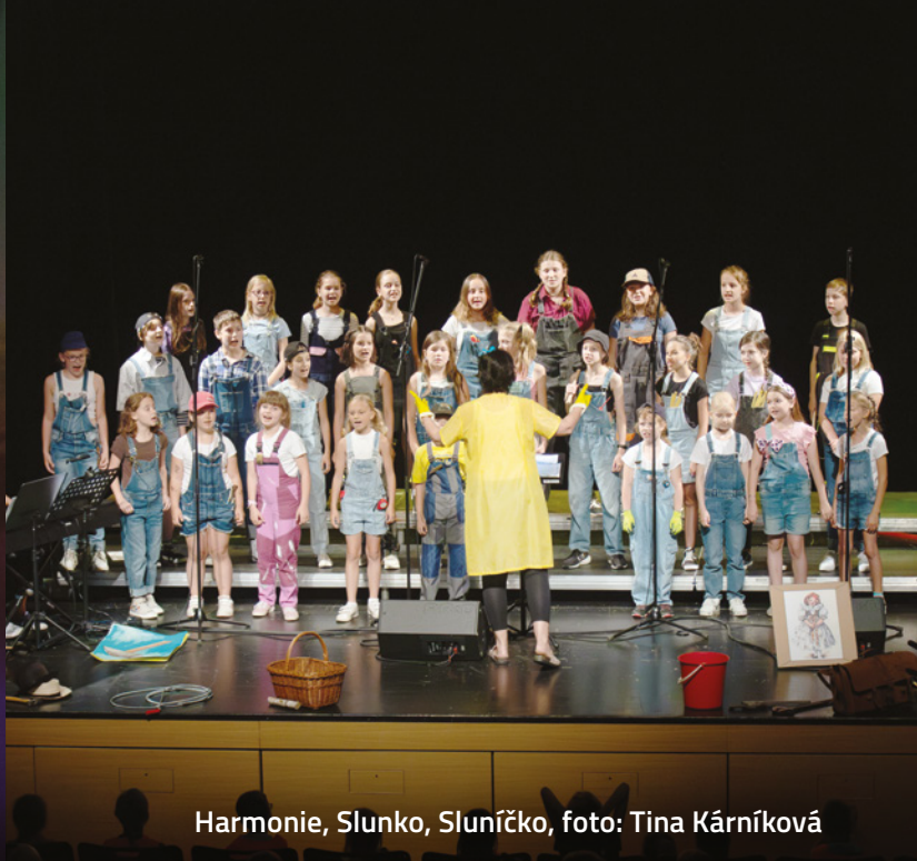
Harmonie, Slunko, Sluníčko