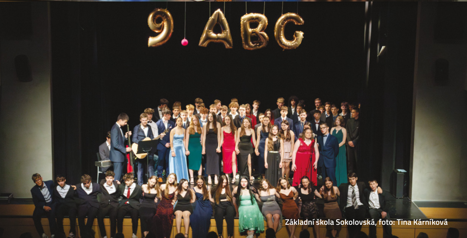
Základní škola Sokolovská