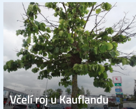
Včelí roj u Kauflandu

V sobotu 1. června 2024 těsně po poledni zasahovala jednotka profesionálních hasičů ze stanice ve Velkém Meziříčí u technické pomoci na ulici U Tržiště ve Velkém Meziříčí. Hasiči místo události zajistili a spolupracovali s přivolaným včelařem při odchytu roje.