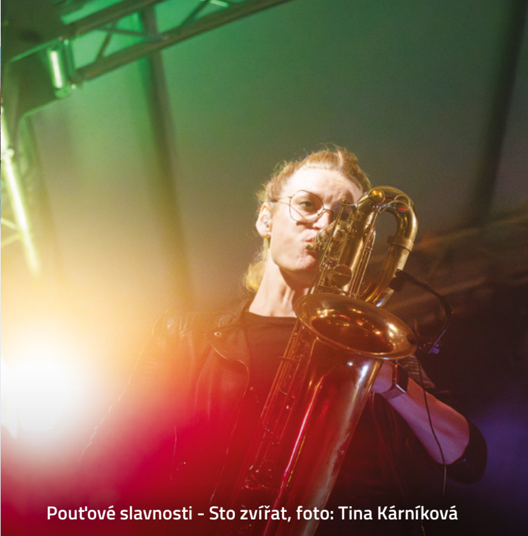
Pout'ové slavnosti - Sto zvířat