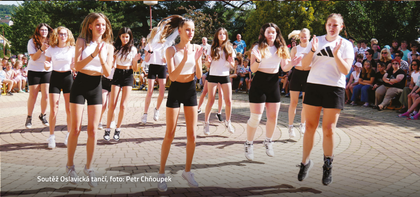
Soutěž Oslavická tančí