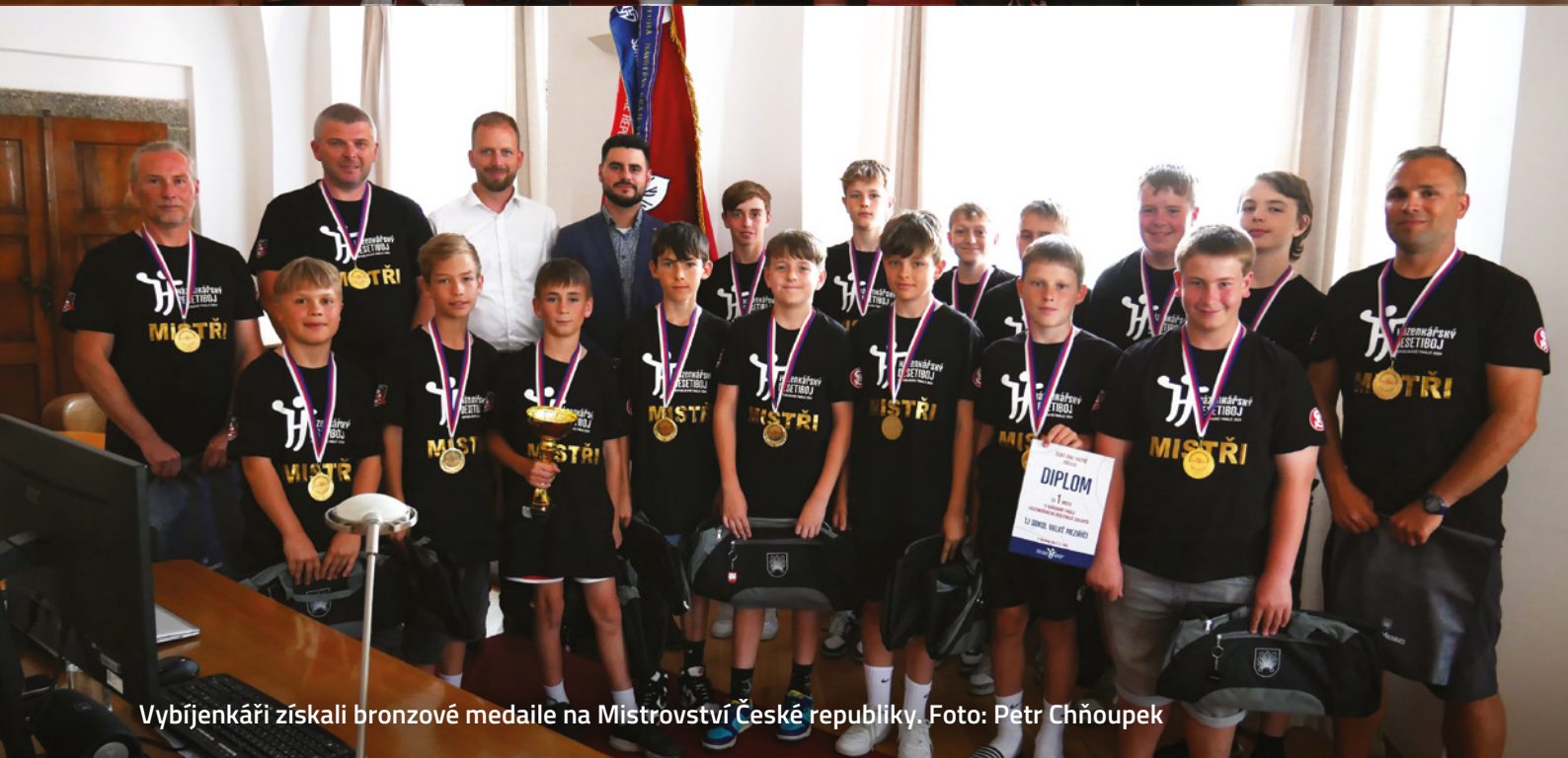
Vybíjenkáři získali bronzové medaile na Mistrovství České republiky.