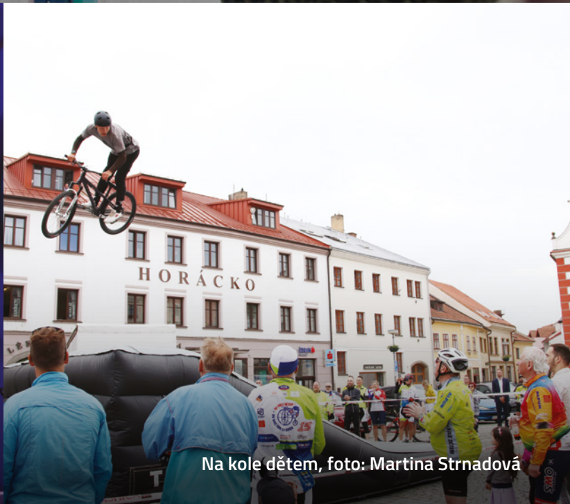
Na kole dětem, foto: Martina Strnadová