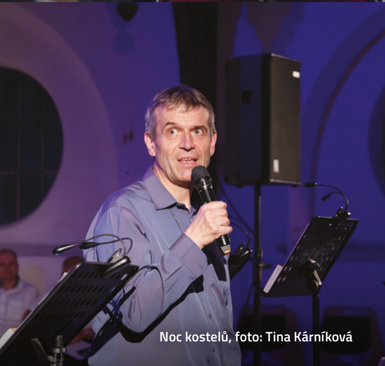
Noc kostelů, foto: Tina Kárníková