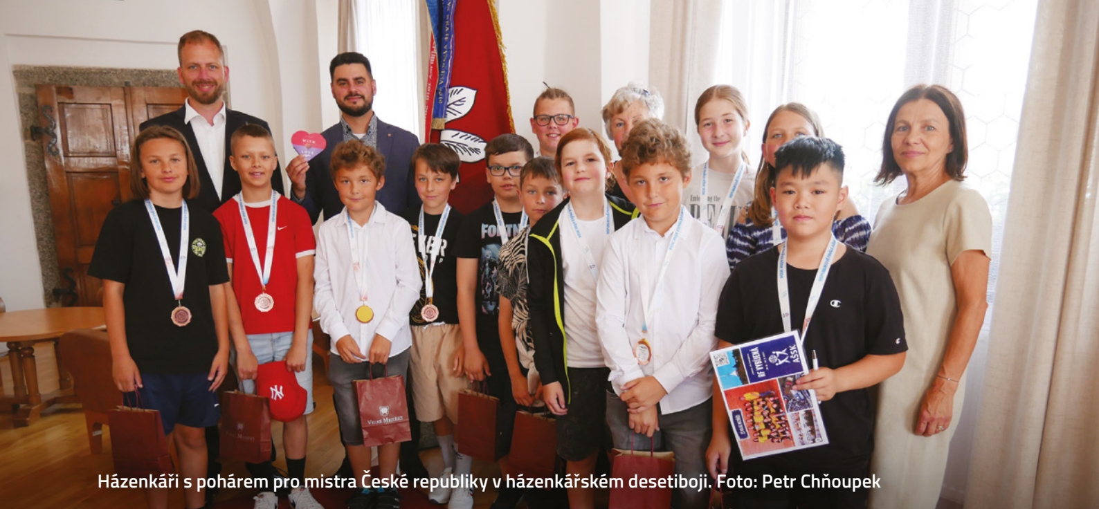
Házenkáři s pohárem pro mistra České republiky v házenkářském desetiboji.