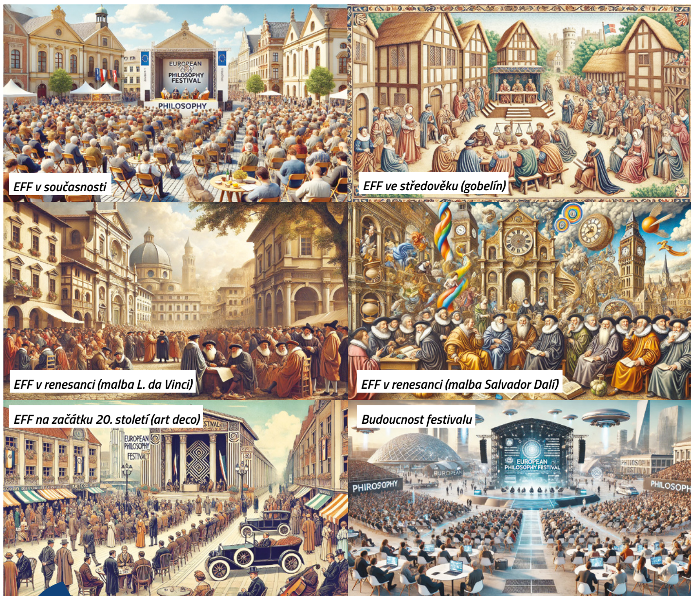
EFF v současnosti