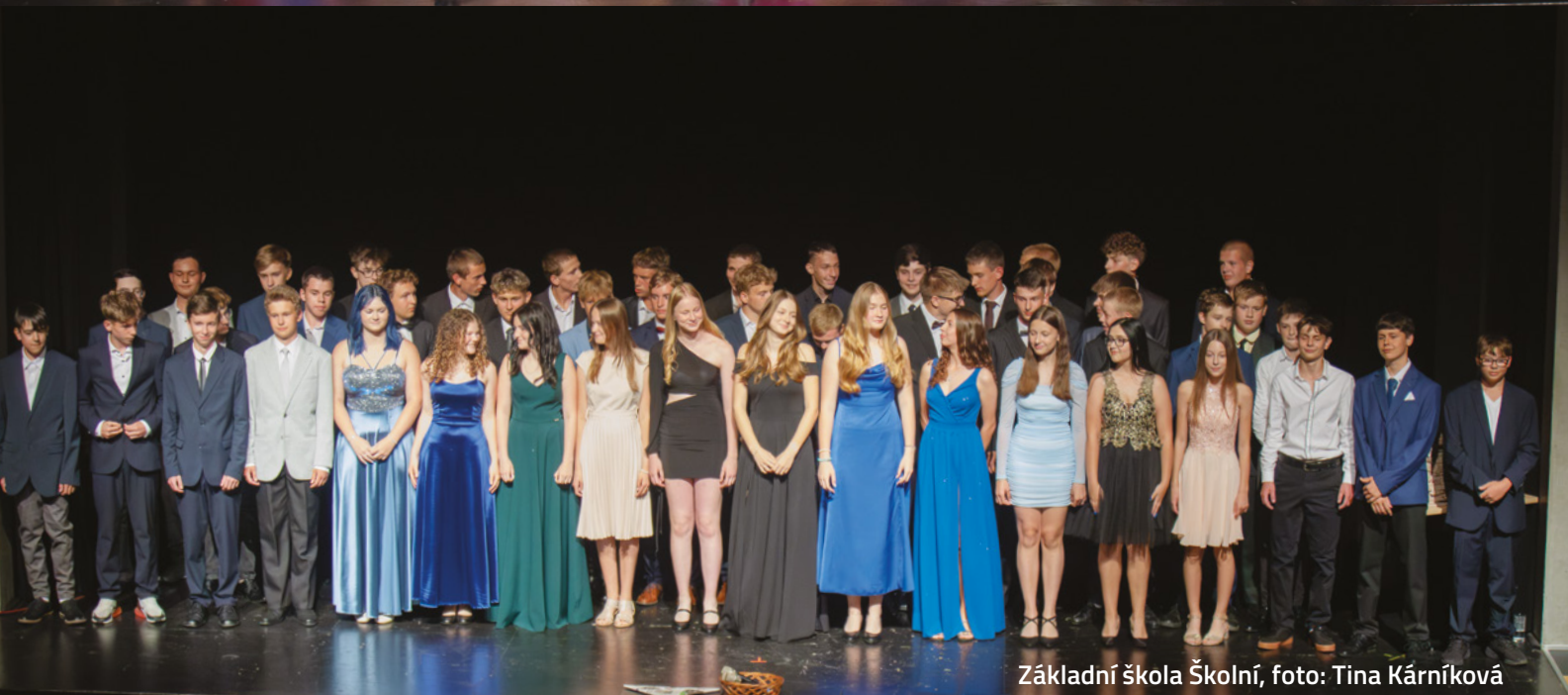
Základní škola Školní