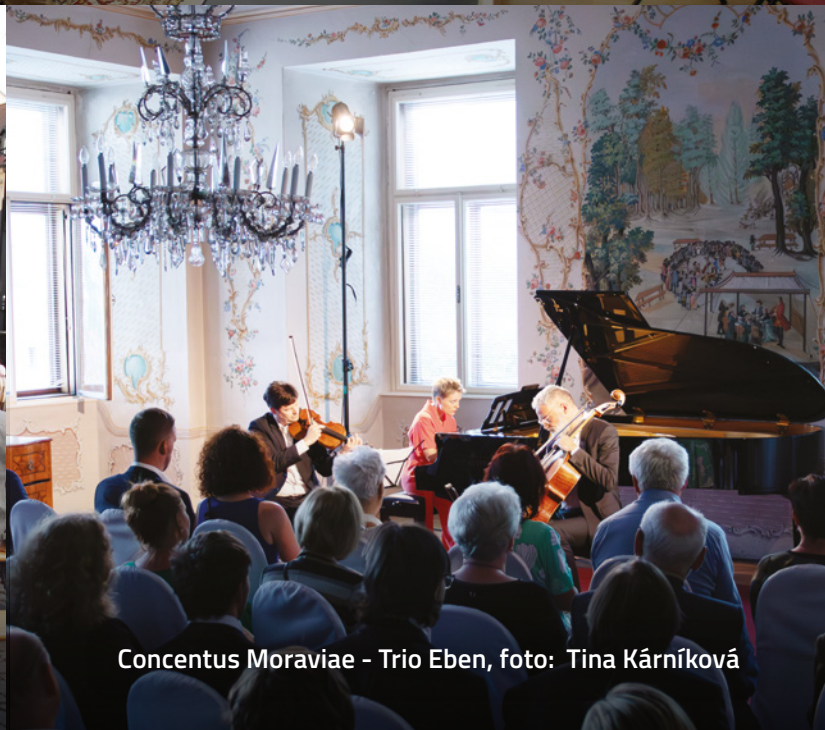
Concentus Moraviae - Trio Eben