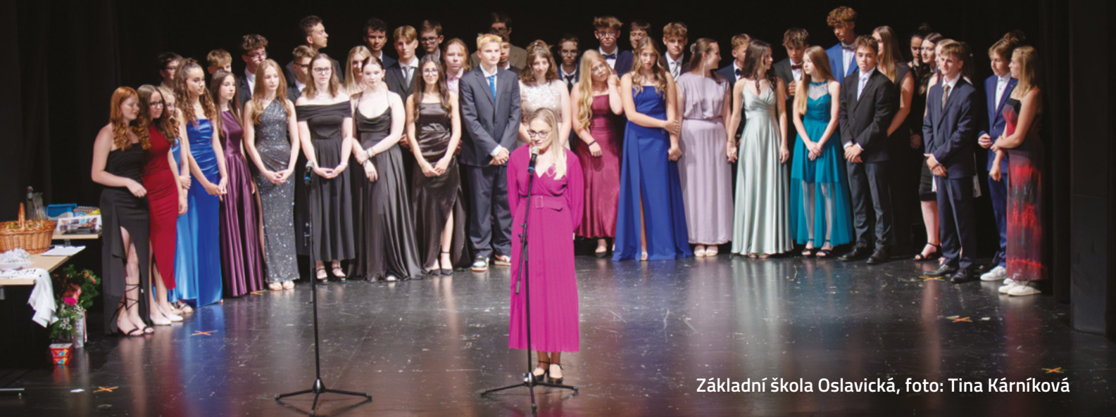
Základní škola Oslavická