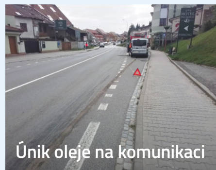
Únik oleje na komunikaci

V sobotu 1. června 2024 těsně po poledni zasahovala jednotka profesionálních hasičů ze stanice ve Velkém Meziříčí u technické pomoci na ulici U Tržiště ve Velkém Meziříčí. Hasiči místo události zajistili a spolupracovali s přivolaným včelařem při odchytu roje.