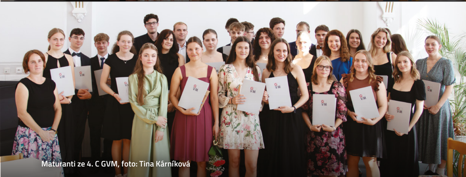
Maturanti ze 4. C GVM