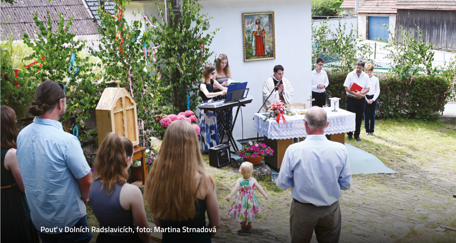
Pout' v Dolních Radslavicích