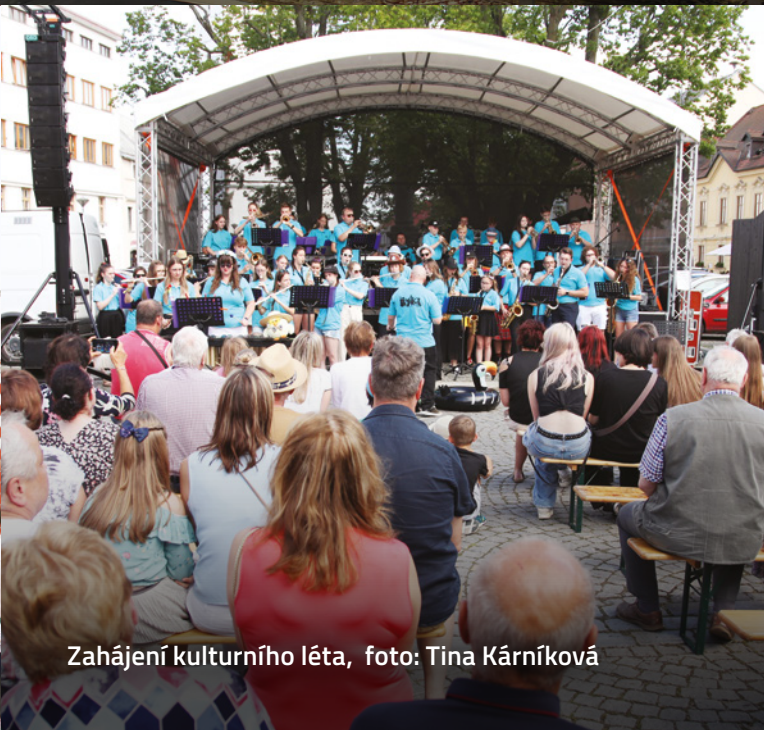
Zahájení kulturního léta, foto: Tina Kárníková