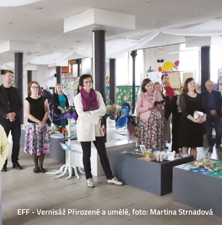
EFF - Vernisáž Přirozené a umělé