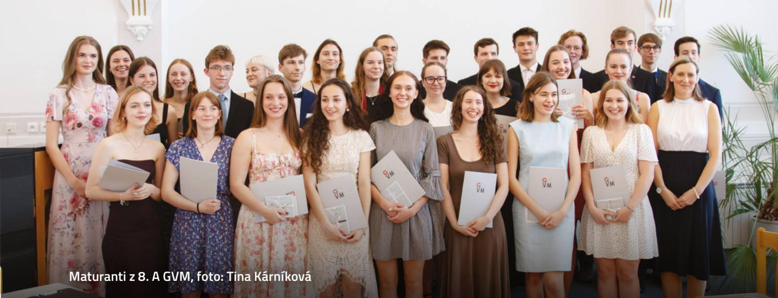
Maturanti z 8. A GVM